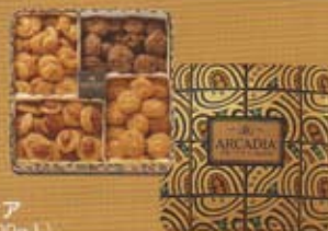
アルカディア 1,620円(300g入)

卵白で仕立てた軽やかな生地にもうストナッツをたっぷり練り込み、サクサクとした食感に焼き上げました。ナッツ特有のカリッとした歯ごたえや香ばしさを引き出すため、一般のクッキーに使うナッツの分量や大きさにもこだわっています。モロゾフが誇るロングセラーの味です。